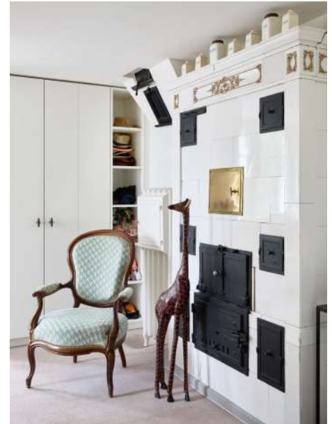
Oben: Der alte Kachelofen und das Biedermeiermobiliar sind Reminiszenzen an die Historie des Hauses.

2020 dann das erste Gespräch und die Begehung vor Ort. «Es ist wichtig, ein Gefühl für ein Haus zu entwickeln», so Hajnos. «Häuser haben eine Geschichte, über die kann man nicht einfach hinweggehen.» Eine fixe Vision gab es zu Beginn nicht. Im Fokus aber stand der Wunsch, einen stärkeren Bezug zum Aussenbereich zu schaffen und die Küche als zentralen Lebensmittelpunkt neu zu denken. Schritt für Schritt entstanden aus Ideen konkrete Pläne, in enger Abstimmung mit Fachberatern der Denkmalpflege und der Natur- und Landschaftsschutzkommission, wo sich Hajnos' langjährige Erfahrung einmal mehr auszahlte.