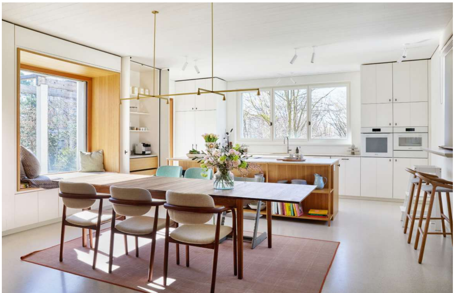
Unten: Die Küche wurde in den neuen Erweiterungsbau verlegt.